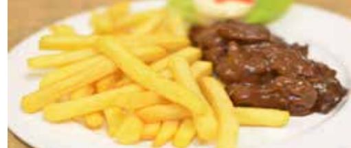
Welkom in ons N-VA-restaurant p. 3