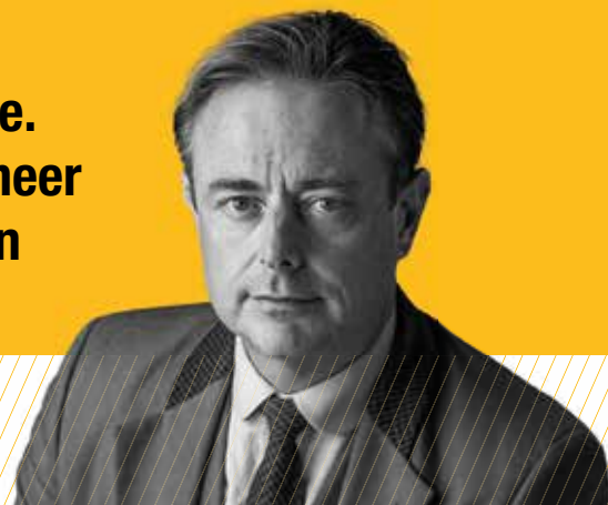
Bart De Wever Voorzitter

Bij de N-VA telt uw stem wél mee. De N-VA zal de komende jaren meer dan ooit waken over de belangen van álle Vlamingen.