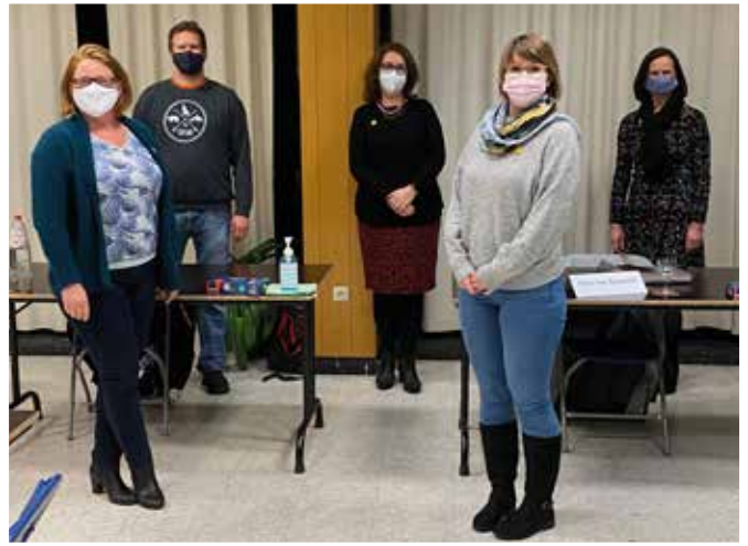
▲ Wist u overigens dat N-VA Schelle de eerste Schelse partij is waarvan 80 % van de gemeenteraadsleden een vrouw is?

Rita zegt: “Regelmatig worden N-VA-voorstellen afgekeurd maar later terug op agenda gezet mits een kleine aanpassing. Dit enkel en alleen om het voorstel zelf te kunnen agenderen en daarmee de pers te halen. Dit soort spelletjes, waardoor