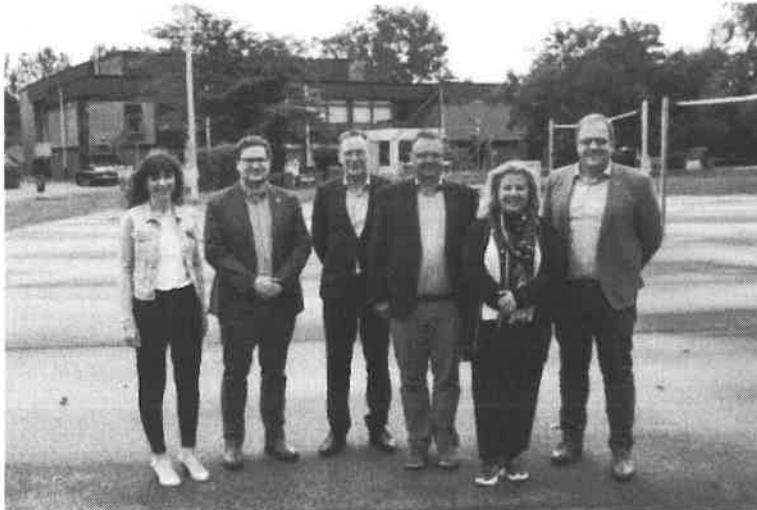
De partners voor het nieuwe intergemeentelijke zwembad op de huidige speeltuin aan de sportlaan in Aartselaar, waar het bad gebouwd zal worden.

AMISHAM De gemeenten Aartselaar, Hemiksem en Niel hebben samen met Igean de plannen voor het nieuwe intergemeentelijke zwembad voorgesteld. De nieuwbouw bestaat onder meer uit een 25-meterbad, een peuterbad en een instructiebad. De start van de bouwwerken is gepland voor begin 2020. "We zijn heel blij dat we onze schoolkinderen zwemwater kunnen blijven aanbieden", klinkt het.