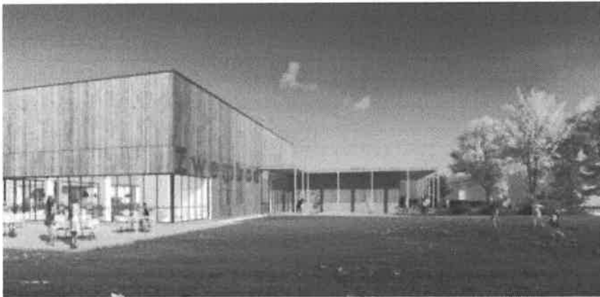
LD Architecten - De buitenkant van het nieuwe zwembad, met veel ramen en een gevel in hout